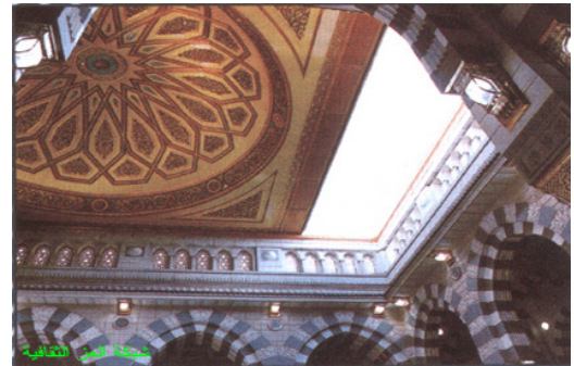
شكل ٢: القباب المتحركة في المسجد النبوي.

وهناك أمثلة على ذلك منها: القباب المتحركة في المسجد النبوي (شكل ٢)، والمظلات المستقاة من خيام البيئة السعودية الصحراوية في ساحته (شكل ٣)، حيث استخدام التكنولوجيا الحديثة كمعالجات بيئية لا يتعارض مع المبني الأصلي التقليدي، فقد تم استخدام القباب المكسوة بخشب مزخرف بزخارف هندسية، وكذلك المظلات بأعمدتها وغطائها ذي اللون الرملي المزخرف باللون الأزرق بزخارف هندسية تتناغم لونا وشكلاً مع المسجد القديم. لقد كان هناك عدد من الحلول الممكنة وفق التكنولوجيا الحديثة، ولكن هذا الحل ذا الصلة بتاريخ المكان وبيئته وثقافته وحضارته يعتبر الأنسب.