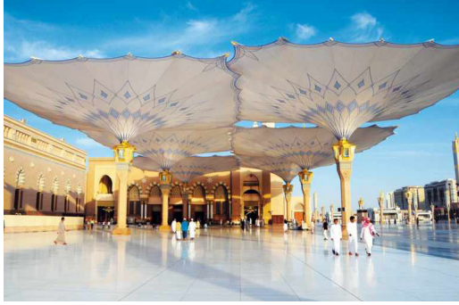
شكل ٣: مظلات المسجد النبوي.