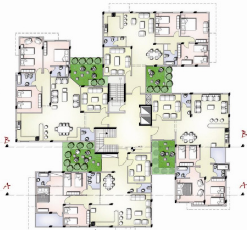
مسقط الطابق الأول

وفي سياق الحفاظ على المضمون التراثي في العمارة يظهر الشكل (١) حلاً من أحد الطالبات في المستوى الثالث لعمارة سكنية متعددة الطوابق يتضح فيه الحرص على الخصوصية للمداخل، وتوفير فكرة الانفتاح على الفناء الداخلي التراثية، حيث تم توفير مكان لشرفة متسعة تكون بمثابة حديقة خاصة صغيرة لكل شقة في كل طابق تطل عليها فراغات حيوية بالشقة.