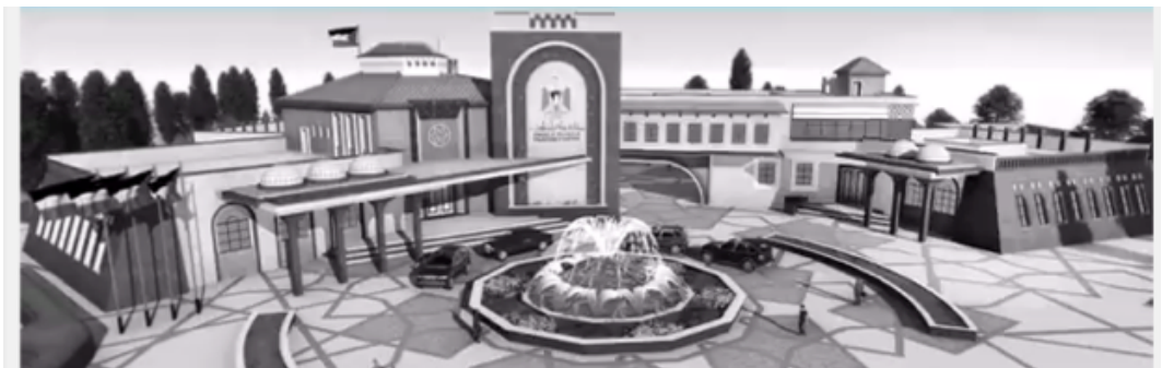
شكل ٥. منظور لأحد المباني في مشروع مجمع سفارة فلسطين في جمهورية تشيلي

في فلسطين: استناداً إلى مشاريع التخرج في الجامعة الإسلامية للأعوام ٢٠١٦، ٢٠١٥، ٢٠١٤، كانت النتيجة وجود مشروعين من أصل ١٦ مشروعاً لعام ٢٠١٦ تحتوي على أفكار وعناصر ذات علاقة بالعمارة التراثية بنسبة ١٢,٥٪ ومسمياتها: تخطيط وتصميم جامعة الإسراء، ومركز ثقافي عثماني فلسطيني، وهناك ثلاثة مشاريع من أصل ١٩ مشروع لعام ٢٠١٥ تحتوي على أفكار وعناصر ذات علاقة بالعمارة التراثية بنسبة ١٥,٧٪، ومما يلفت الانتباه أن مسميات هذه المشاريع تستدعي استخدام العمارة التراثية وهي: مجمع التاريخ والتراث الفلسطيني، ومجمع سفارة فلسطين في جمهورية تشيلي، وقد احتوى على رموز من العمارة الفلسطينية والتشيلية (شكله)، والثالث